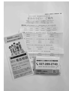
電話相談の番号を保管しやすいよう、カードサイズで配布しています